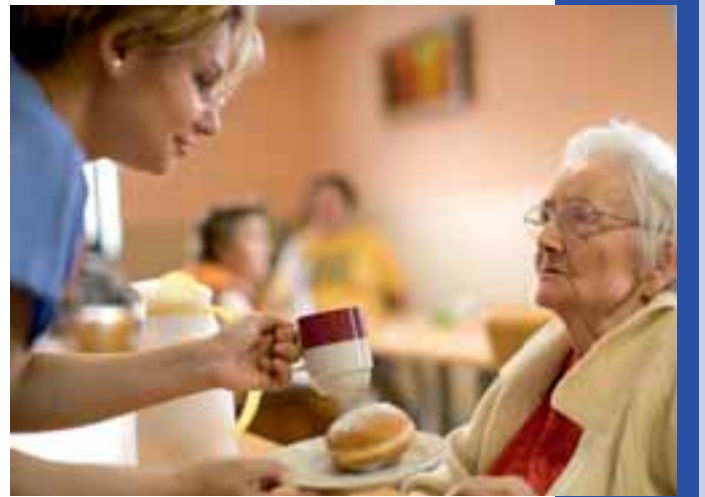
38% der Pflegebedürftigen können ihren Pflegeheimplatz nicht selbst bezahlen